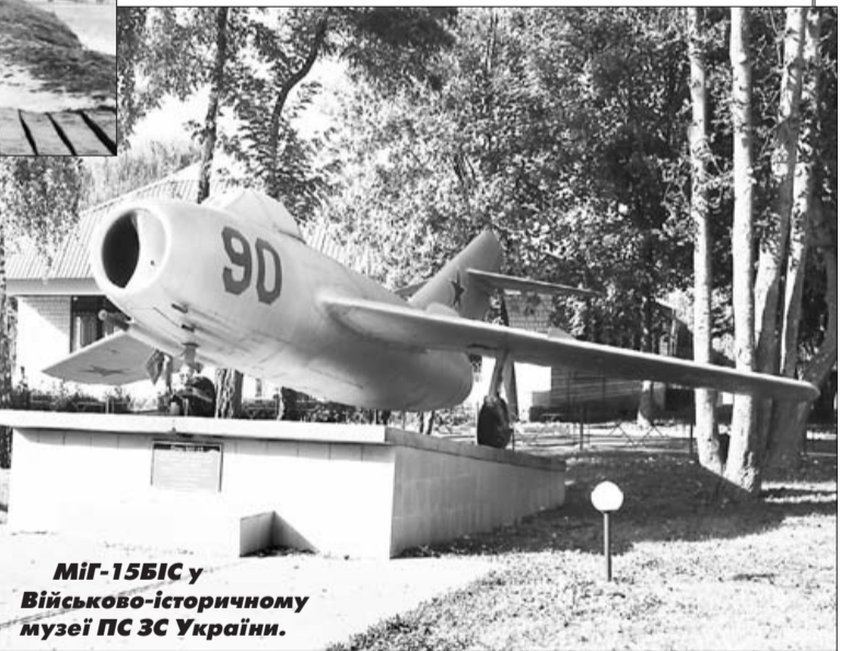
МіГ-15БІС у Військово-історичному музеї ПС ЗС України.